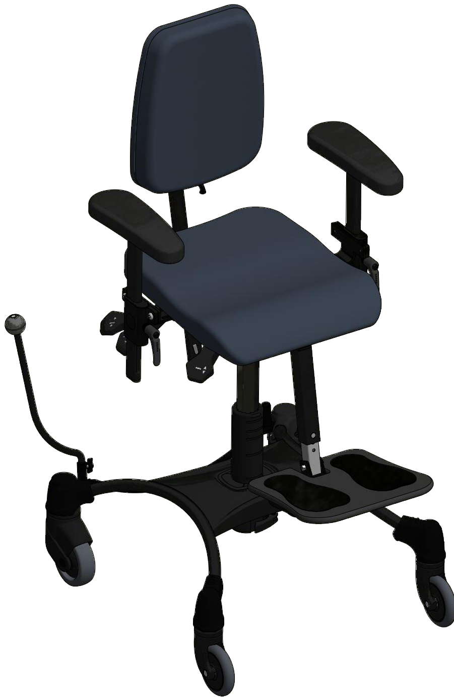
VELA Tango 100 S