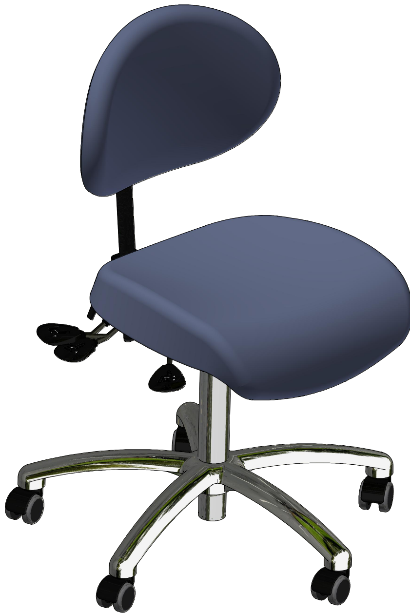
VELA Latin 100