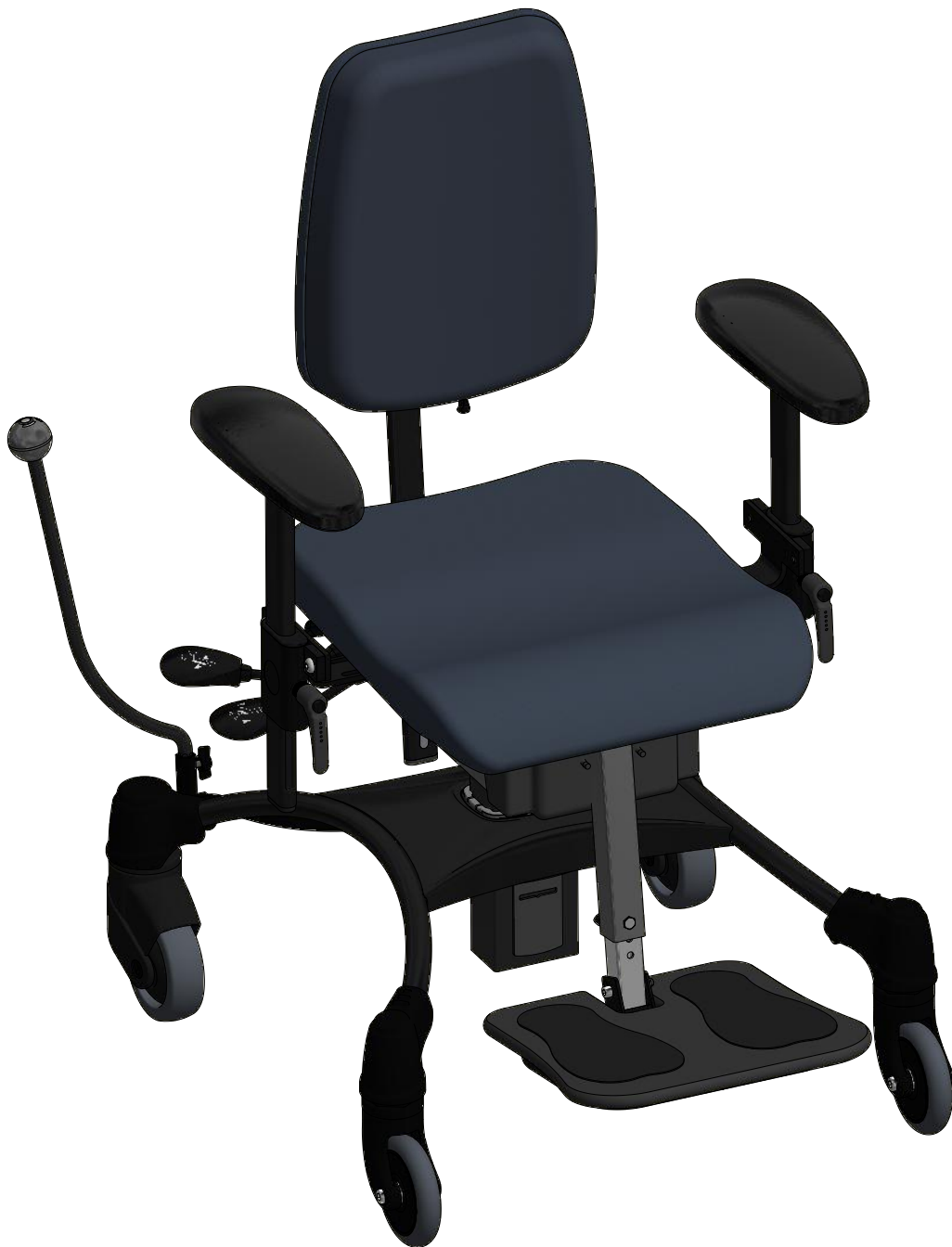
VELA Tango 100 ES